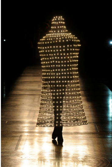
Moritz Waldemeyer, Korbähnlicher Mantel für Philip Treacy, Lichttechnik Moritz Waldemeyer © Design/Foto: Moritz Waldemeyer