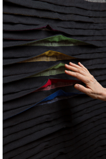
Manuela Leite, Faltengewebe mit Bewegungssensorik, bei Bewegung öffnen sich die farbigen Falten, 100% Baumwolle © Design: Manuela Leite