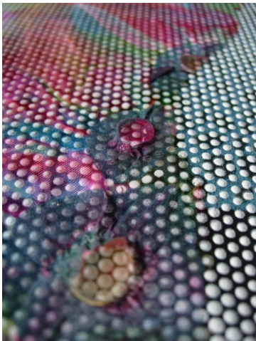
Uta Tischendorf, Farbwesen , 50% Baumwolle, 50% Polyester, Gewebe und Organza verklebt, Kombination aus Shibori, Transfer- und Siebdruck