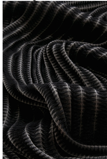
Josefine Düring, Farce double , 50% Wolle, 50% Polyurethan, große Waffelbindung, Schaftgewebe © Design/Foto: Josefine Düring