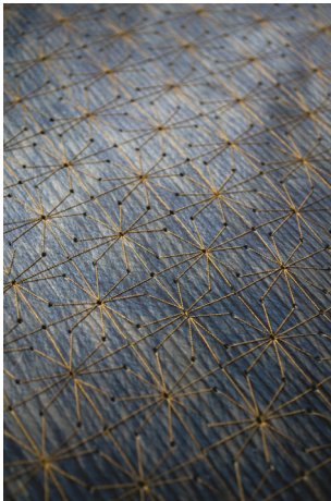
Josefine Düring, Pinifere Profonde , veredeltes Holzfurnier, 100% Fichte, Siebdruck mit Reaktivfarben, perforiert, bestickt