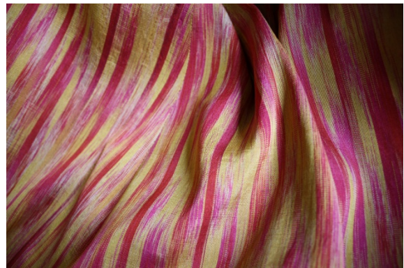
Annegret Lembcke, Ikatgewebe, 100% Seide, Kettikat, handgefärbt und handgewebt in Aleppo, Syrien