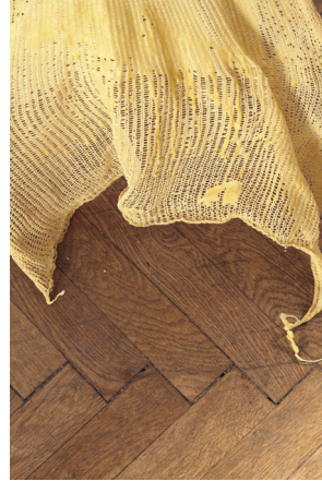
Julia Kortus, Gestrick, 100% Baumwolle, getaucht in 100% Bienenwachs © Design: Julia Kortus