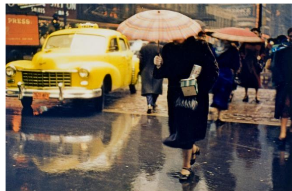
Arthur Siegel, Rainy Day, aus der Serie State Street