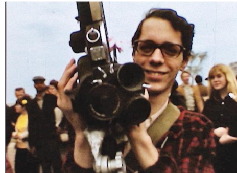
Robert Stiegler, Full Circle, 1968 Einzelbild aus dem digitalisierten Film