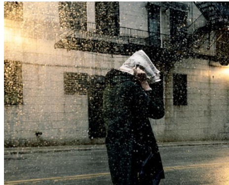
Clarissa Bonet, Caught in the Storm (aus der Serie City Space), 2011