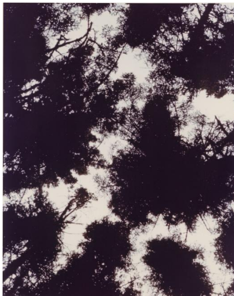
Albert Szabo, Ohne Titel, 1960