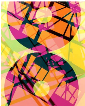
Doug Fogelson, Forms and Records No. 8, 2014