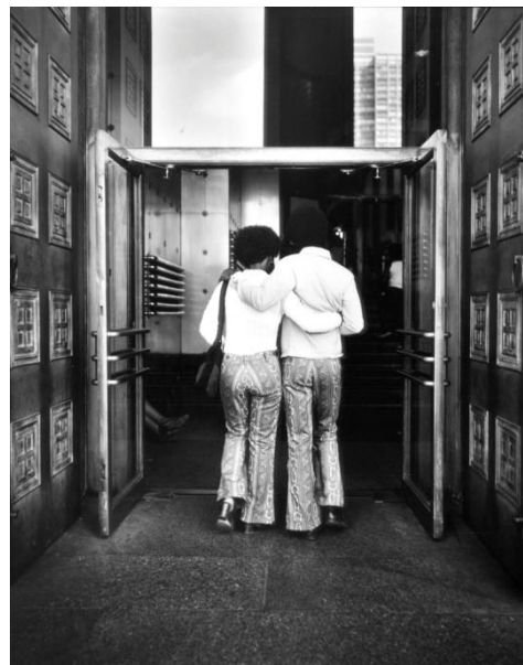
Barbara Crane, People of the North Portal, 1970 Museum of Contemporary Photography Chicago