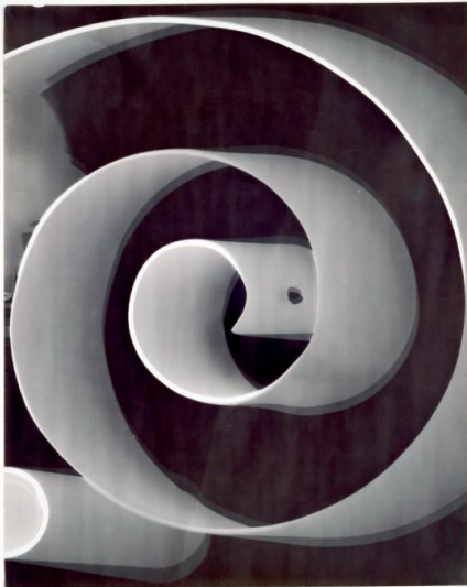
László Moholy-Nagy, Fotogramm ohne Titel, 1943 Bauhaus-Archiv Berlin