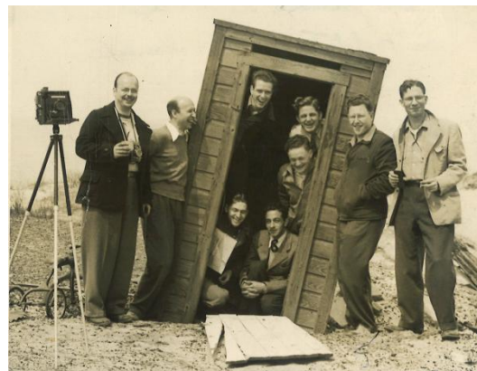
Callahan Class at Indiana Dunes Exkursion der Fotoklasse mit Harry Callahan, 1948