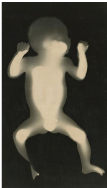
Charles Swedlund, Ohne Titel (Fotogramm eines Babys), 1957 Bauhaus-Archiv/Museum für Gestaltung (Schenkung des Künstlers) © Charles Swedlund/Stephen Daiter Gallery, Chicago