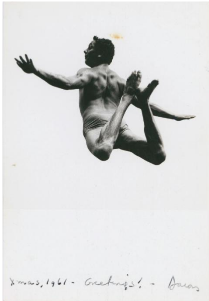
Aaron Siskind, Pleasures and Terrors of Levitation, 1961 Bauhaus-Archiv Berlin © Aaron Siskind Foundation