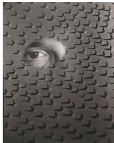
Nathan Lerner, Eye on Nails, 1940 Bauhaus-Archiv Berlin © VG Bild-Kunst, Bonn 2017