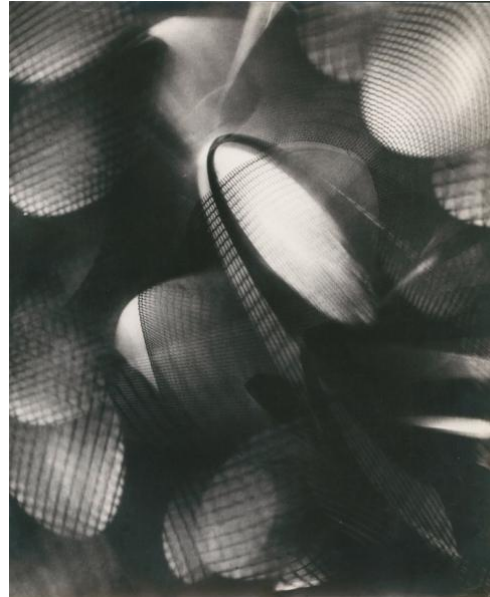
Arthur Siegel, Ohne Titel, 1949 Bauhaus-Archiv Berlin © The Estate of Arthur Siegel