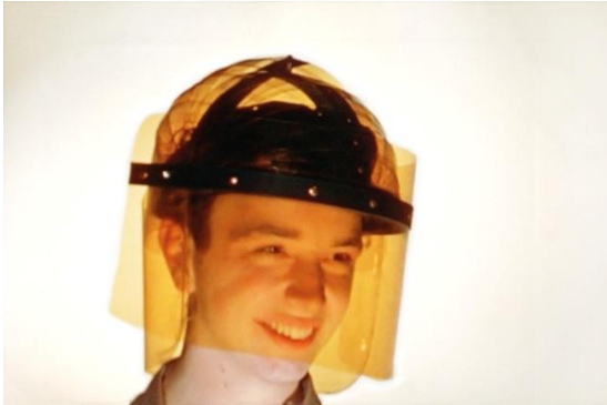
László Moholy-Nagy mit Studenten des Institute of Design, Design Workshops, 1944 (Einzelbild aus dem Film)