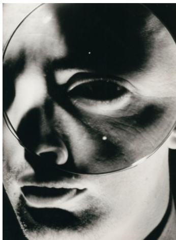
Nathan Lerner, Charlie's Eye, 1940 Bauhaus-Archiv Berlin © VG Bild-Kunst, Bonn 2017