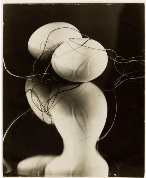
György Kepes, Eggs and Strings, 1942 Bauhaus-Archiv Berlin © Juliet Kepes-Stone